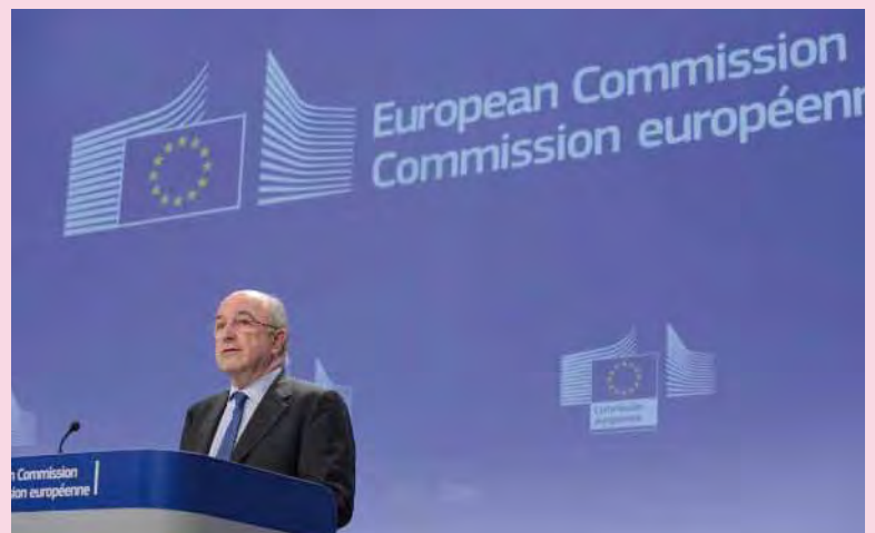
Joaquín Almunia, vicepresidente y comisario de Competencia