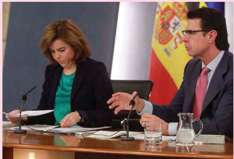
Soraya Sáenz de Santamaría, vicepresidenta del Gobierno, ministra de la Presidencia y Portavoz del Gobierno, junto con José Manuel Soria, ministro de Industria, Energía y Turismo, durante la rueda de prensa posterior al Consejo de Ministros.