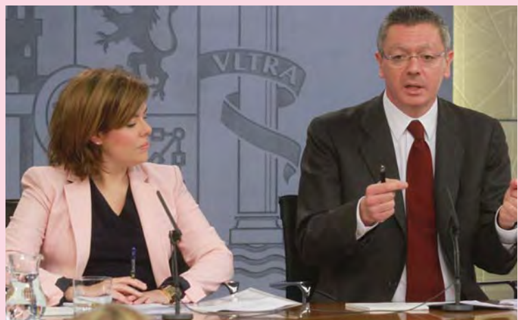
La vicepresidenta, Soraya Sáenz de Santamaría, y el ministro de Justicia, Alberto Ruiz-Gallardón, en la rueda de prensa posterior al Consejo de Ministros