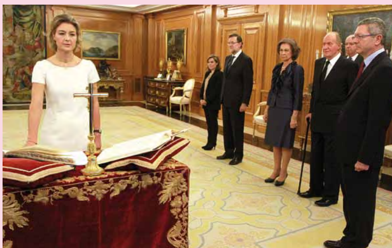
Acto de jura ante el Rey de la nueva ministra de Agricultura, Alimentación y Medio Ambiente, Isabel García Tejerina, en el Palacio de la Zarzuela