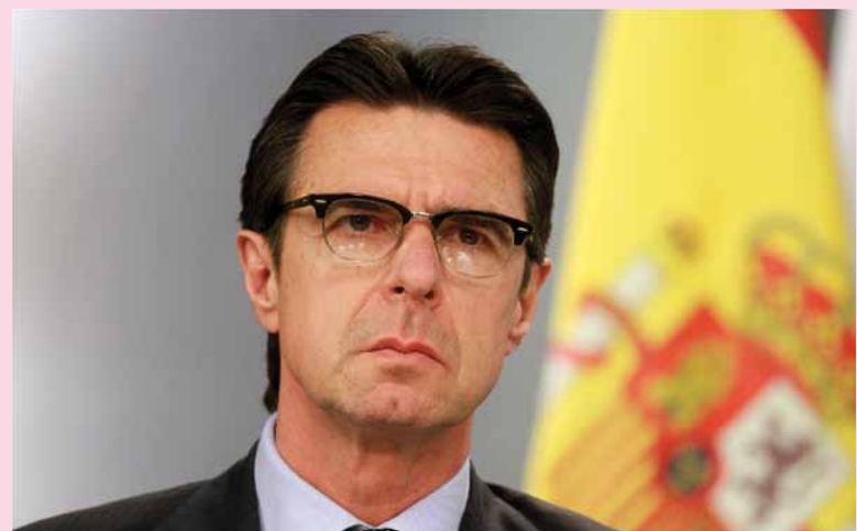
El ministro de Industria, Energía y Turismo, José Manuel Soria, durante la rueda de prensa posterior al Consejo de Ministros