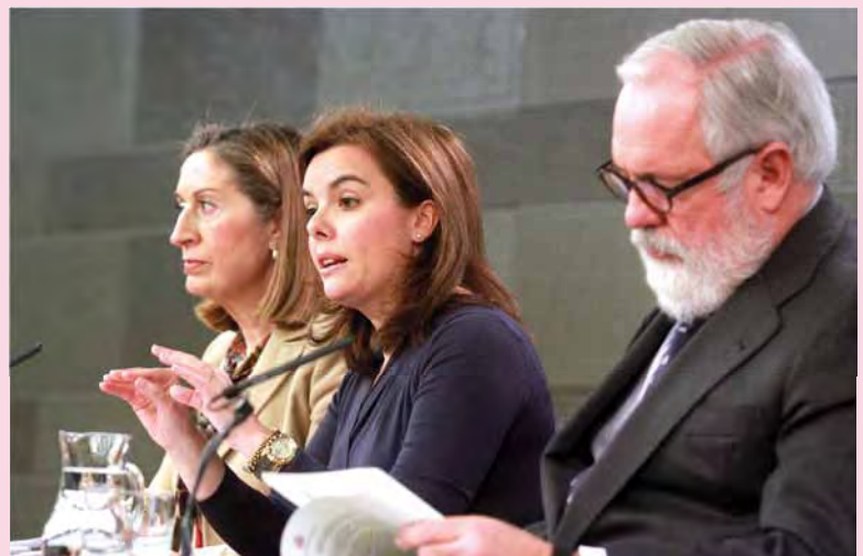
Soraya Sáenz de Santamaría, junto a Ana Pastor y Miguel Arias Cañete, en la rueda de prensa posterior al Consejo de Ministros