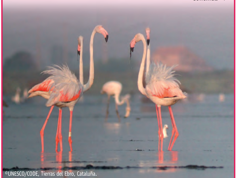
Tierras del Ebro, Cataluña.